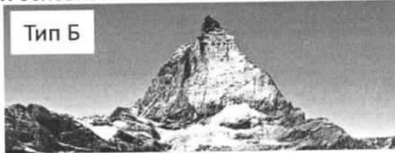
Тип Б Процесс: Выветривание / выветривание

В таблице приведены горы с несколькими близкими по высоте вершинами. Используя информацию о «вторых» вершинах и характерных наборах природных поясов, заполните пустующие ячейки таблицы. Укажите: