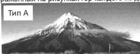
Тип А Процесс: Вулканизм / поднятие литосферных плит

Задача 1. Особенности генезиса (формирования) гор часто можно определить по их внешнему виду. Какие эндогенные процессы стали главной причиной образования изображенных на рисунках гор каждого из двух основных типов?